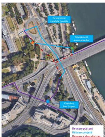
Modifications du réseau