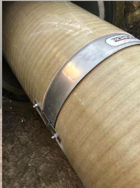
Tube PRV Manchon NON DEBORDANT en INOX