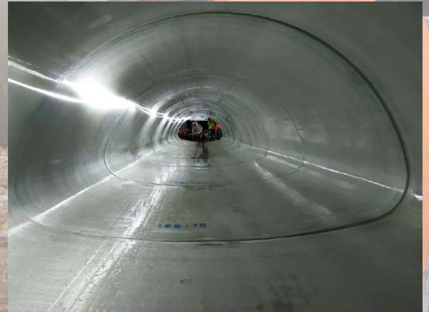
Coque PRV ARCHE – ELLIPSE - OVOIDE