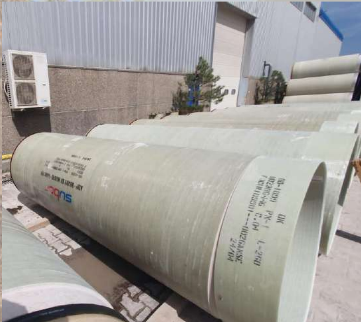
Tube PRV Manchon NON DEBORDANT en PRV