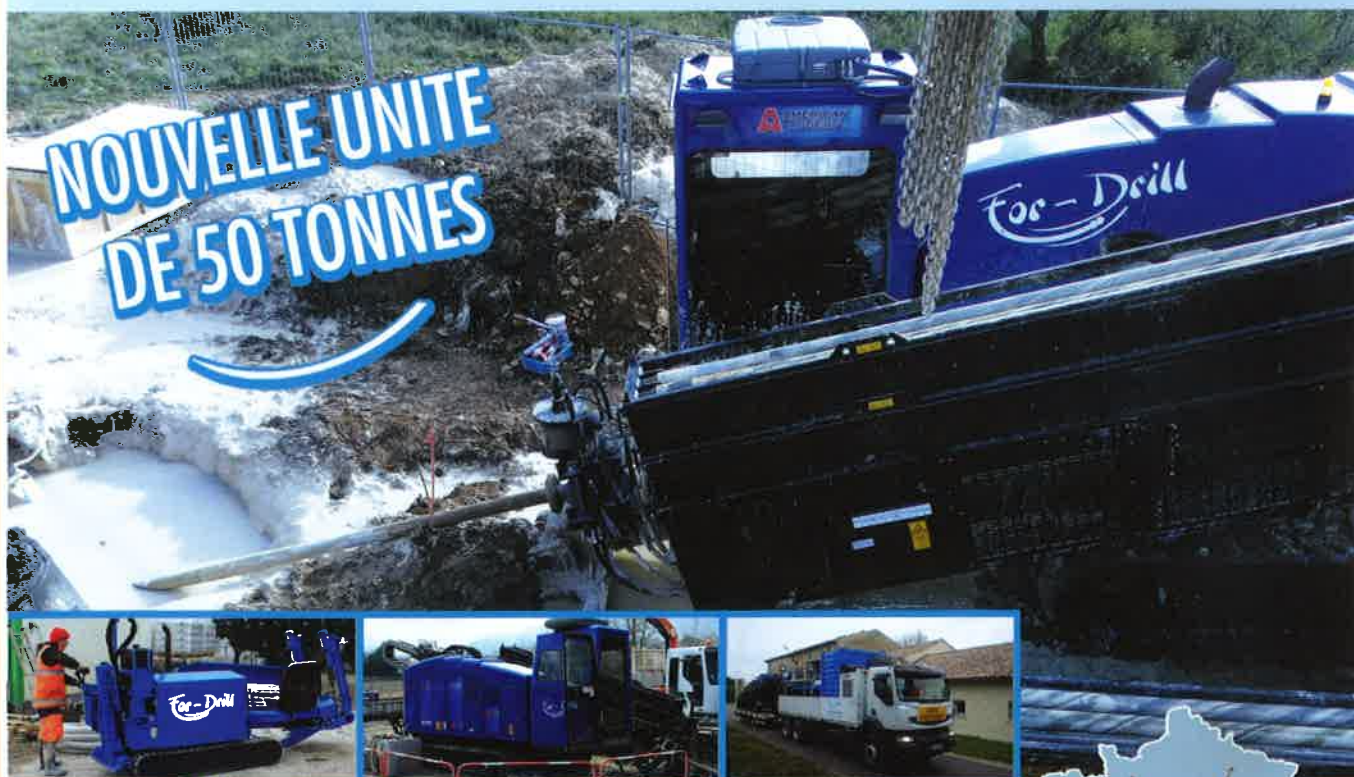
NOUVELLE UNITE DE 4 TONNES

“ Entreprise Vauclusienne dynamique, réactive et innovante dans le domaine des travaux sans tranchées spécialisée en forage dirigé. Equipée de matériels de nouvelle génération en mesure d'exécuter tout forage horizontal adapté à tout type de sol sur l'ensemble du territoire. Un chef d'entreprise expérimenté, accompagné d'un personnel hautement qualifié capable d'assurer la pose de canalisations du ø 40 mm au ø 800 mm sur des longueurs pouvant atteindre 600 m. ”